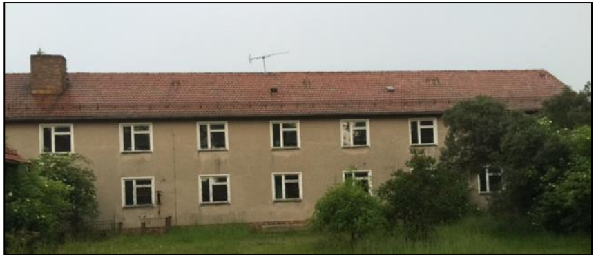
Abbildung 2: Zweigeschossiges Gebäude im östlichen Bereich des Flurstücks