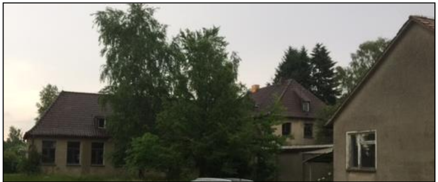
Abbildung 3: Blick in Richtung Norden auf weitere Gebäude, die abgebrochen werden sollen